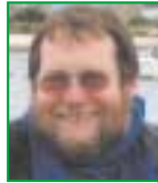
Récit et photos Dominique Lanaud (W650 / Steib S500) Provins (77)