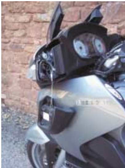
Bout de ficelle et bricolage express.

Vous pouvez retrouver l'intégralité de l'essai sur notre site internet : journaldesmotards.com