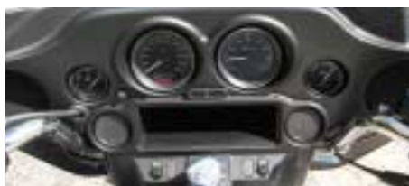
Tableau de bord. Les compteurs sont très lisibles sur un tableau de bord bien équipé. Comme dans une voiture sans la clim! Mais le "Street Glide" est mieux équipé que le "Standard" avec sa radio, ses différents manos, ses rétros pris dans le carénage.

Texte et photos Gérard Magliocco CDLR à L'Albenc (38)