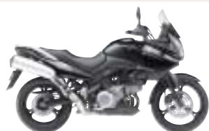
Suz DL1000 V-Strom