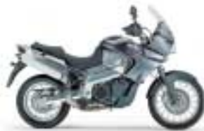
Aprilia 1000 Caponord