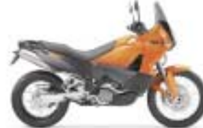
KTM 990 Adventurer