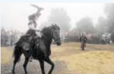
Grand festival Médiéval du Château de Peyrepertuse 2007