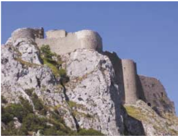
Le château cathare de Peyrepertuse