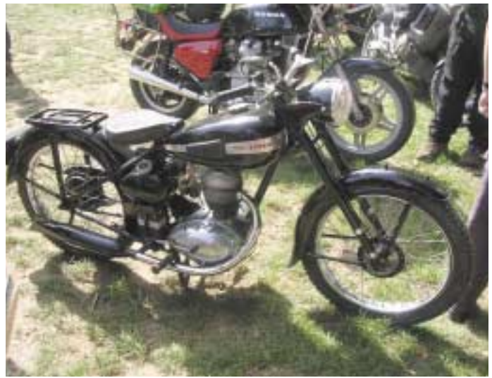
Une mémé bien lustrée !

Nous les quitterons non sans avoir fait des emplettes car l'heure du repos commence à se faire sentir.