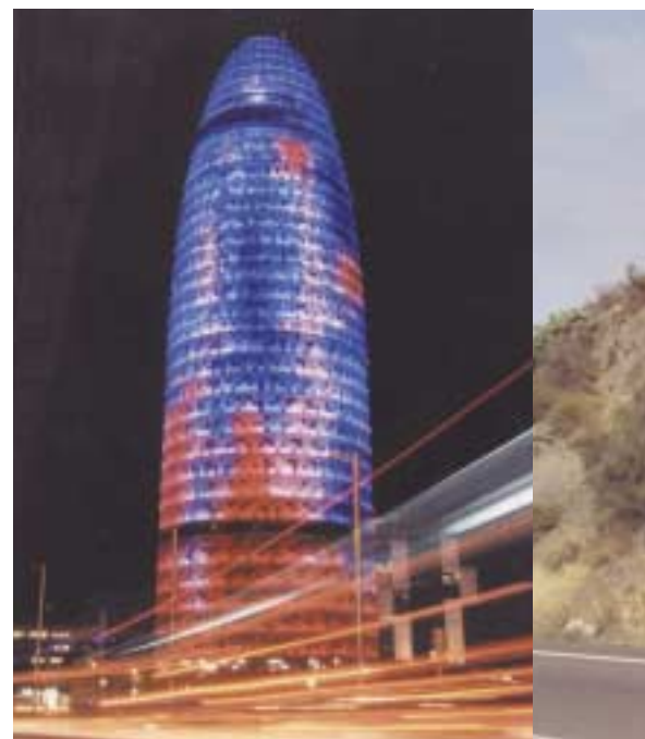
Barcelone by night. Le cigare brille de mille feux.

Nous suivons la côte, un panneau indicateur nous interpelle, nous aurillacois ! El Cantal ! Tout un programme.