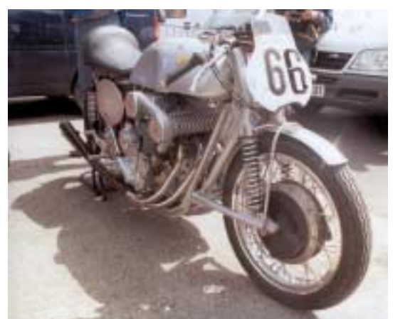
500S4. Italienne construite à Turin en 1939 par Sergio Secondo, machine exceptionnelle amenée par le club italien ASI, machine dont on ignorait l'existence.