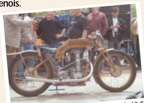
Motosacoche. M 35 de 1927 (moto présentée par le club du motocycliste), elle a reçu la coupe de la Mairie de Dijon.