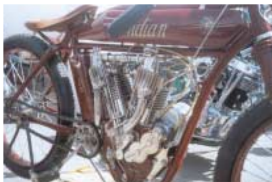
Indian. Plus simple, plus beau, tu meurs !

Réservez votre week-end des 26 et 27 mai 2007, la 15 e édition arrive à maturité, venez la déguster... sans modération !