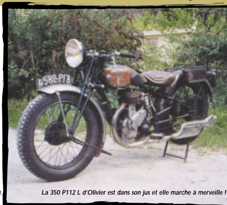
La 350 P112 L d'Olivier est dans son jus et elle marche à merveille !