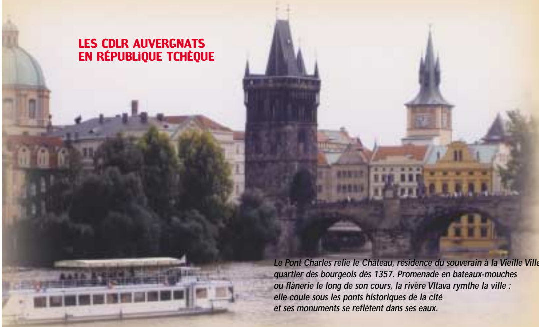
Le Pont Charles relie le Château, résidence du souverain à la Vieille Ville, quartier des bourgeois dès 1357. Promenade en bateaux-mouches ou flânerie le long de son cours, la rivière Vltava rythme la ville : elle coule sous les ponts historiques de la cité et ses monuments se reflètent dans ses eaux.

Bleu, blanc, rouge : les français sont là !