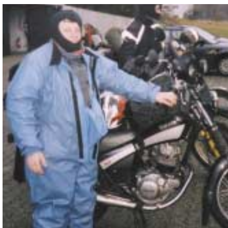
Un sacré stroumph bricoleur !